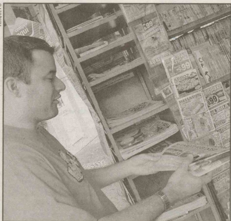
Leitores podem se inscrever também pelo e-mail

É uma forma de interação entre a redação e o público, que poderá analisar o conteúdo informativo e dar sugestões